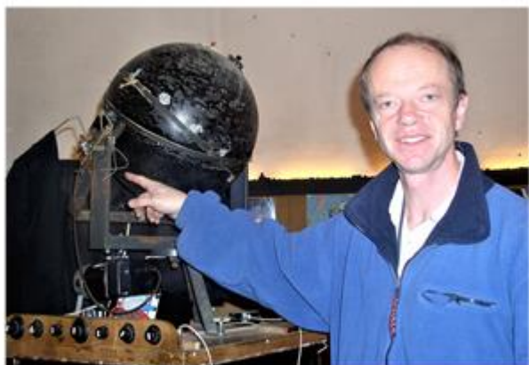
Projektoren fra 1937 i Stjernerummet

Stjernerummet projektor blev bygget på Ernst Nachtigals værksted, Schmiedestrasse 9 i Lübeck – tæt ved Klingenberg, hvor vi havde vores full dome telt. Under krigen blev værkstedet ramt af en bombe. Kun ydermurene stod tilbage. I dag ligger Atlantic Hotel på adressen.