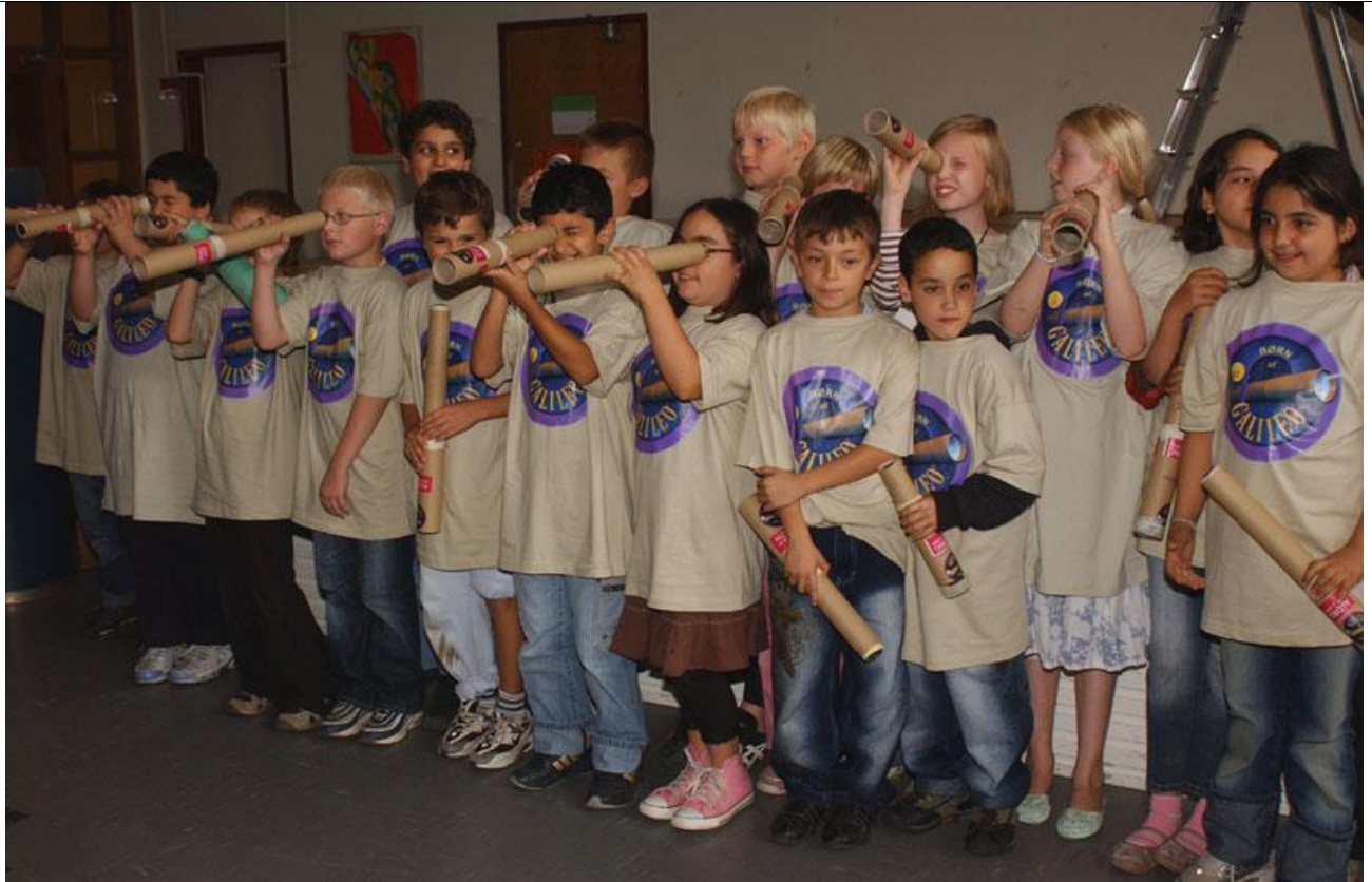
Eleverne fra 4. v ved indvielsen af pilotprojektet Børn af Galileo på Bellahøj Skole