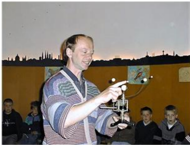
Undervisning i Stjernerammeret i Brønshøj.