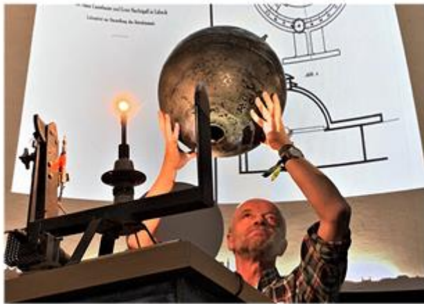
Projektoren vises frem i Lübeck.