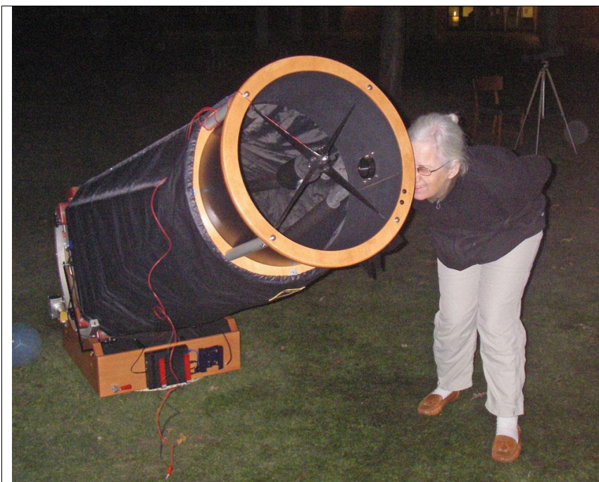
Projektets 40 cm Dobsonian ved en kikkertaften på Bellahøj Skole