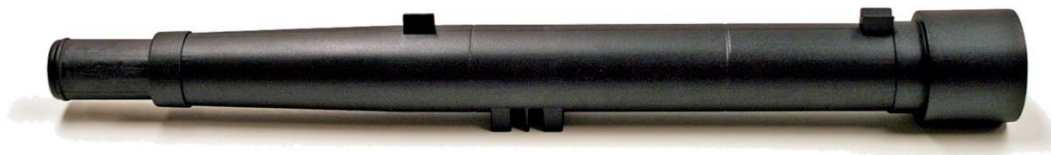
Galileoscope model. Photo by Stephen M. Pompea and Richard Tresch Fienberg. www.galileoscope.org

Her ses Galileoscopet. Først når man sætter det på et fotostativ kan man få glæde af det. Galileoscopet har en møtrik der passer til skruen på ethvert fotostativ.