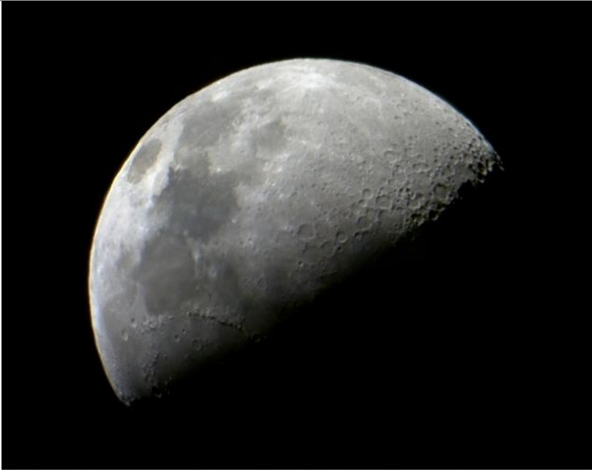
The Moon as seen in a Galileoscope prototype.

Dette er et foto af Månen taget gennem en prototype af galileoscopet. Kraterne er imponerende tydelige. Hvis man observerer Månen i det første eller det sidste kvarter af Månens faser – altså når Månen er smal – så vil skyggerne være lange. Da vil krater-bunden ligge i skygge mens kraterranden er belyst. Man kan da være heldig at få øje på den centrale forhøjning midt i krateret, fordi det kan være belyst mens bunden ligger i skygge. Forhøjningen midt i krateret blev dannet, da Månen trykkede tilbage efter at være blevet ramt af et kæmpe nedslag.